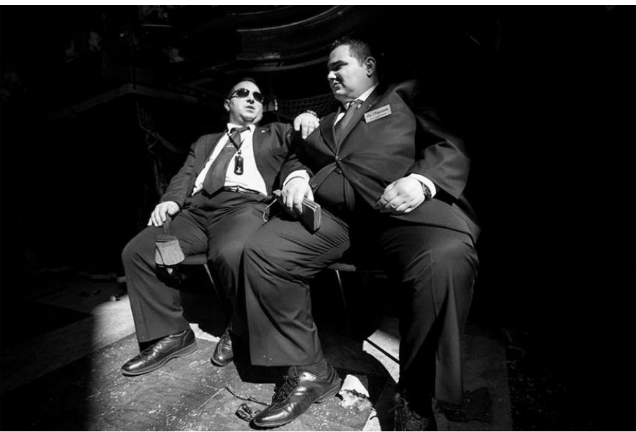
La stanchezza