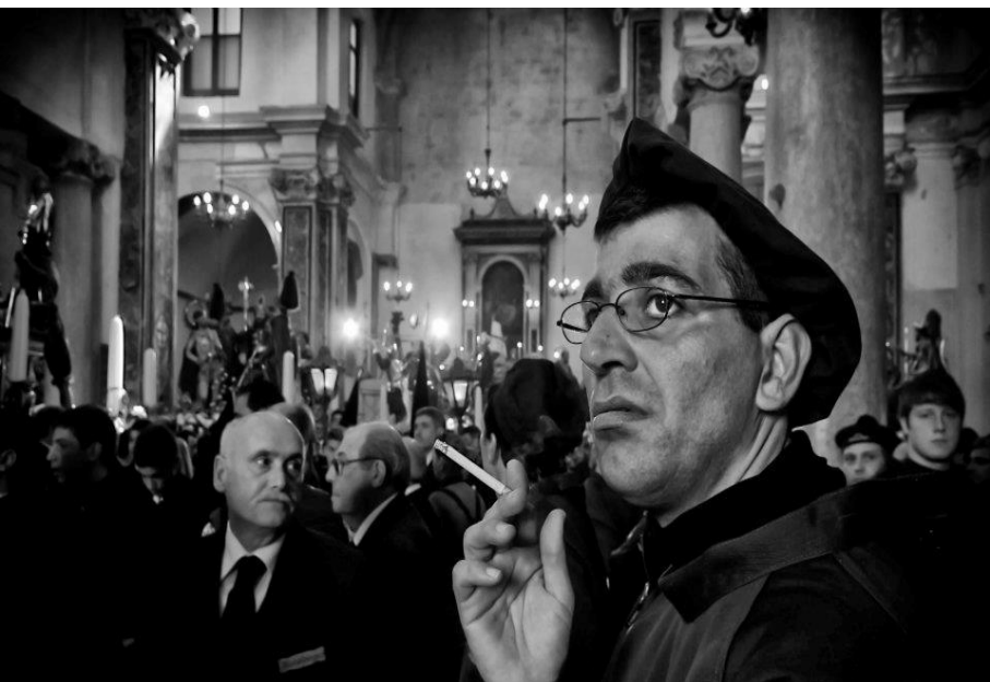
Prima dell'uscita - Ph Francesco Paolo Iovino