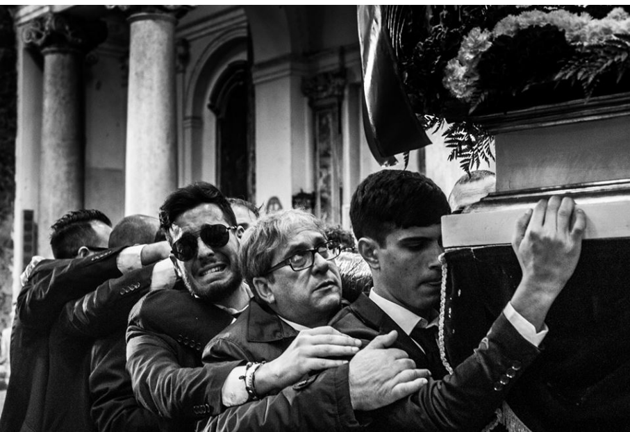
Devoti all'asta