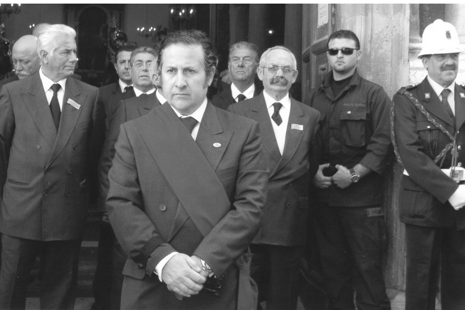
Giovanello D'Aleo

lendolo dall'organo associativo. Contemporaneamente a quello in tribunale si aprì pure un processo a cielo aperto dove una sostanziosa parte di suoi devoti continuò a ritenerlo una colonna, anzi la “colonna”; l'altra parte invece lo flagellò a sangue. Sembra una scena già vista. Ma nessuno dorma.