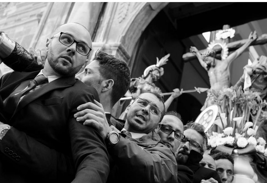
L'entrata - Ph Enzo Figuccio